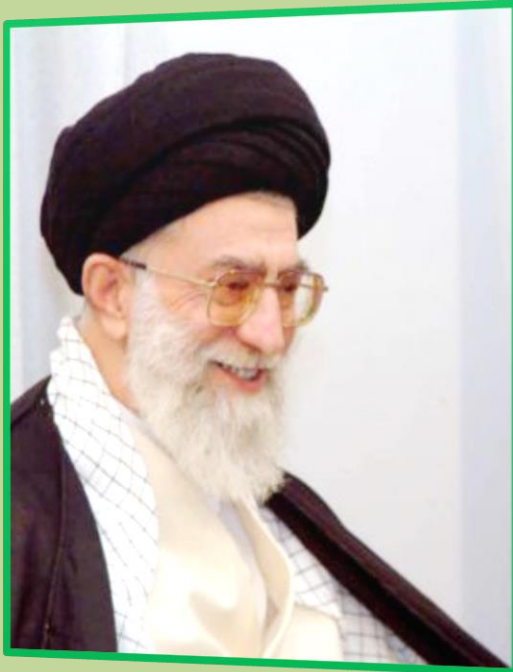
هفته گرامیداشت مقام معلم - اردیبهشت ۹۷

آنچه من مطالبه میکنم و توقع دارم از دستگاه آموزش و پرورش، این است که زمان بندی کنید؛ یک زمانی را مشخص کنید و بگویید تا چه مدتی این سند، تحقق کامل پیدا خواهد کرد. البته کار سختی است لکن این کار سخت باید انجام بگیرد؛ دستگاه های مختلف همه باید کمک کنند به آموزش و پرورش؛ همه باید کمک کنند